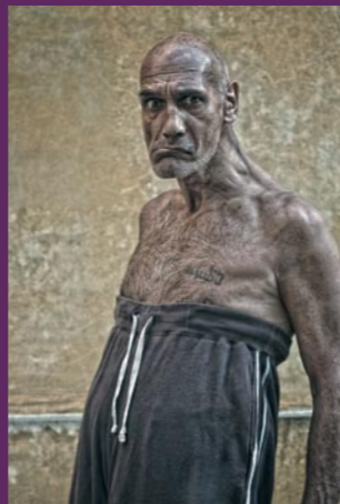
Gráfica: Lucrezia Casimondi, Rimini, Itália

Accademia della Follia apoia a música da banda Trem Tan Tan, liderada pelo mestre Babilak Bah (percussionista, compositor e poeta).